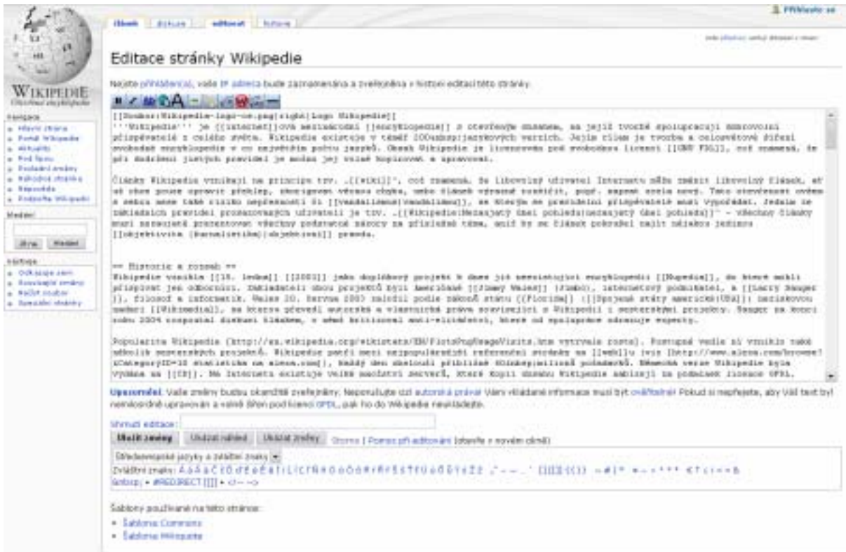
Obr. 2. Editace článku na Wikipedii