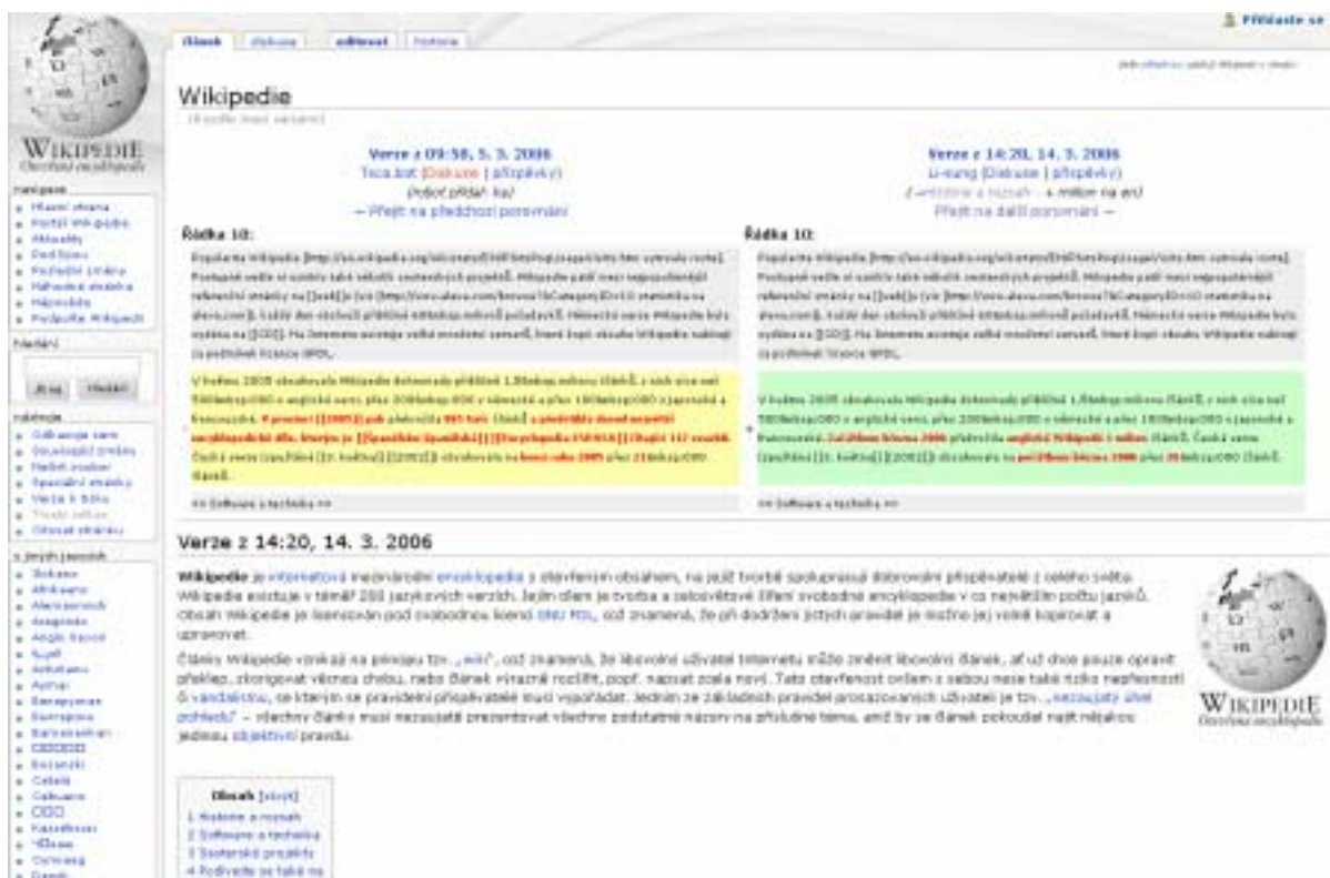
Obr. 4. Diff odpovídající změně v článku