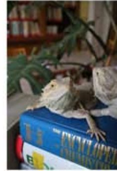
Knihovna je prostor