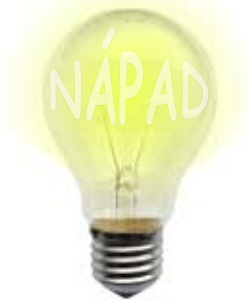
informační gramotnost pro doktorandy