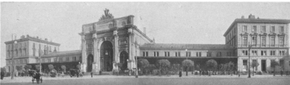
Denisovo nádraží dříve a dnes