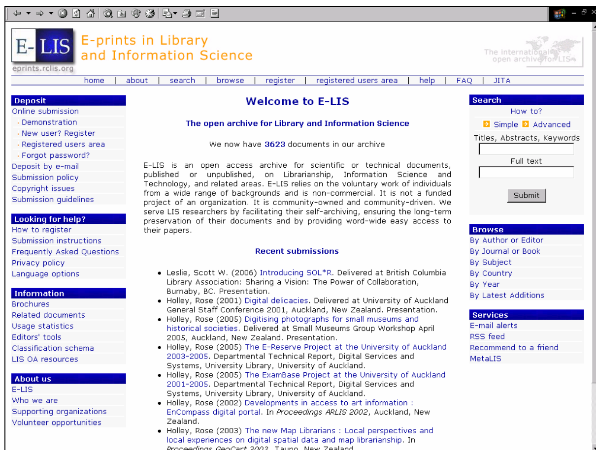
Obr. č. 1: domovská stránka elektronického archivu E-LIS s prezentací zkrácených záznamů nově uložených přírůstků [převzato 2006-04-28]

Archiv E-LIS nabízí uživatelům řadu funkcí (viz obr. č. 1). Koncovým uživatelům jsou k dispozici dílčí funkce pro vyhledávání informací typu prohlížení (browse) a typu přímého dotazování (search). Autorům je po registraci (register) umožněn přístup k trvalému ukládání dokumentů a tvorbě metadat (registered users area). Systém zajišťuje i další informační služby (např. RSS). Je rovněž připraven na sklizeň metadat na základě protokolu OAI-PMH. Od 20. 1. 2003 je zaregistrován v centrále iniciativy OAI (Open Archives Initiative) včetně bazového URL ( http://eprints.rclis.org/perl/oai2 ). Metadata archivu jsou tedy dosažitelná pro všechny návazné informační služby. Pro uživatele jsou připraveny příručky a pro náhodné zájemce je k dispozici již bohatá dokumentace včetně propagačních brožur a letáků. Specifické místo je věnováno prezentaci vlastní oborové klasifikace JITA (viz část 3.4).