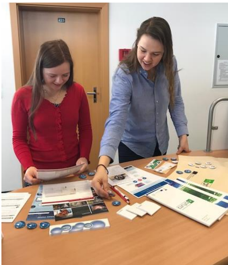
Obr. č. 3: Studentky UP na pobočce knihovny Fakulty tělesné kultury.

Na jednotlivých pobočkách Týden s EIZ probíhal podobně, i když s přizpůsobením možnostem dané pobočky. Na Přírodovědecké fakultě měli vyhrazený jeden počítač, u kterého propagační akce probíhala. Knihovny LF a FZV kromě tematických nástěnek, uspořádaly společně v rámci tohoto týdne dva semináře věnované EIZ. Na CMTF a FTK měli propagační předměty na výpůjčním pultu a zájemcům říkali informace k EIZ přímo u něj.