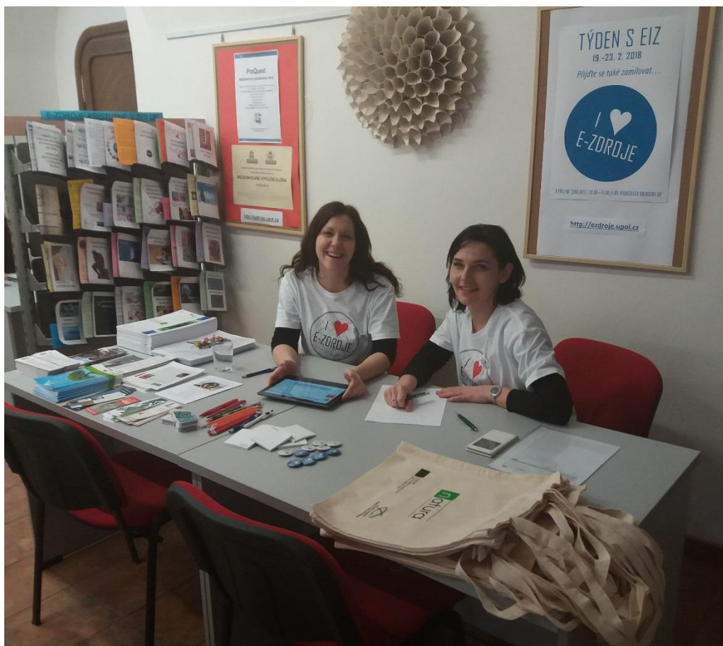
Obr. č. 2: Infopult v přízemí Ústřední knihovny ve Zbrojnici.

V pondělí jsme v přízemí, na dohled od vstupních dveří, v místnosti, která slouží přes noc jako noční studovna, vytvořili prostor, kam mohli všichni zájemci i náhodní návštěvníci knihovny přijít a získat informace o všem, co je z problematiky EIZ zajímavé.